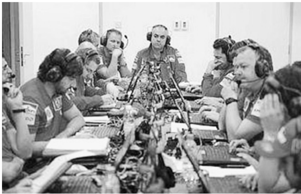
Una riunione di tecnici Ferrari: lavoreranno anche per il Coni